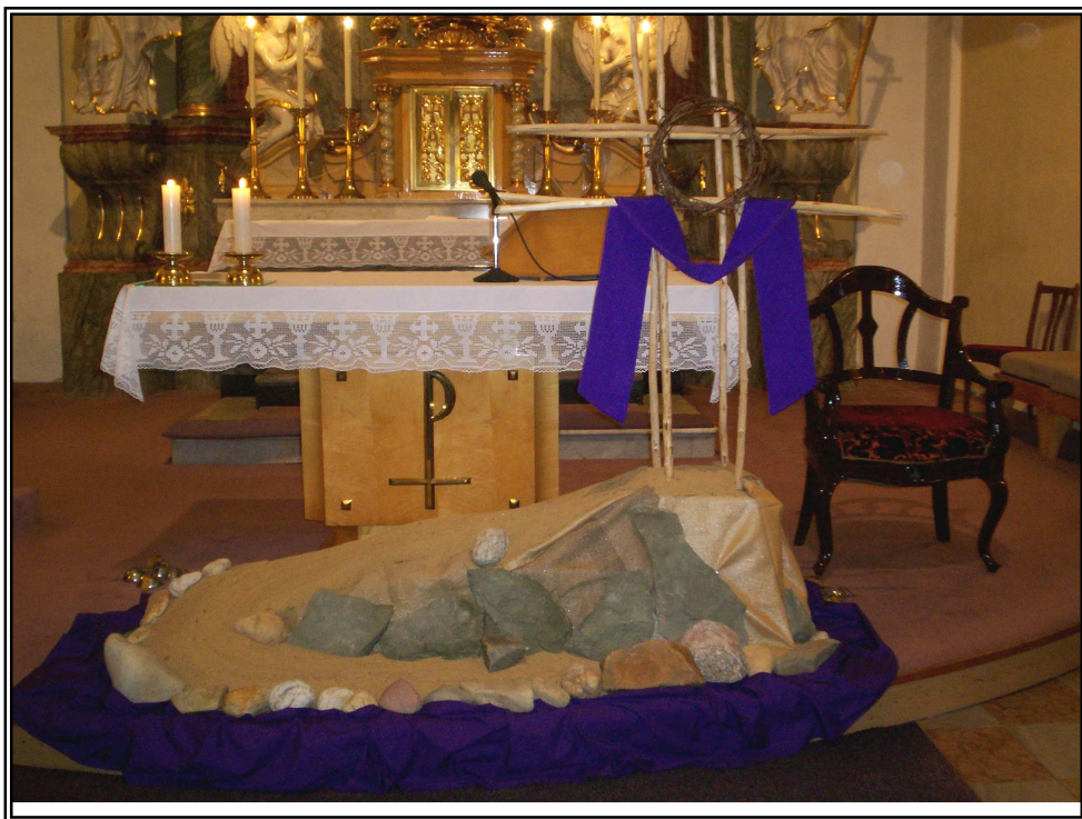
aranžmá Kalvárie - postní motiv