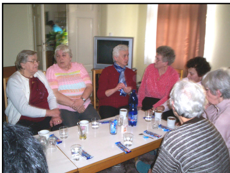
Připravila Marie Ohrálová