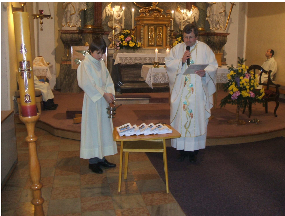
Žehnání NEDĚLNÍČKU