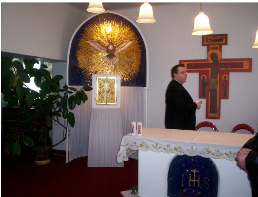
Kaple v budově televize Noe