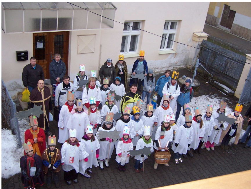
Žehnání koledníků