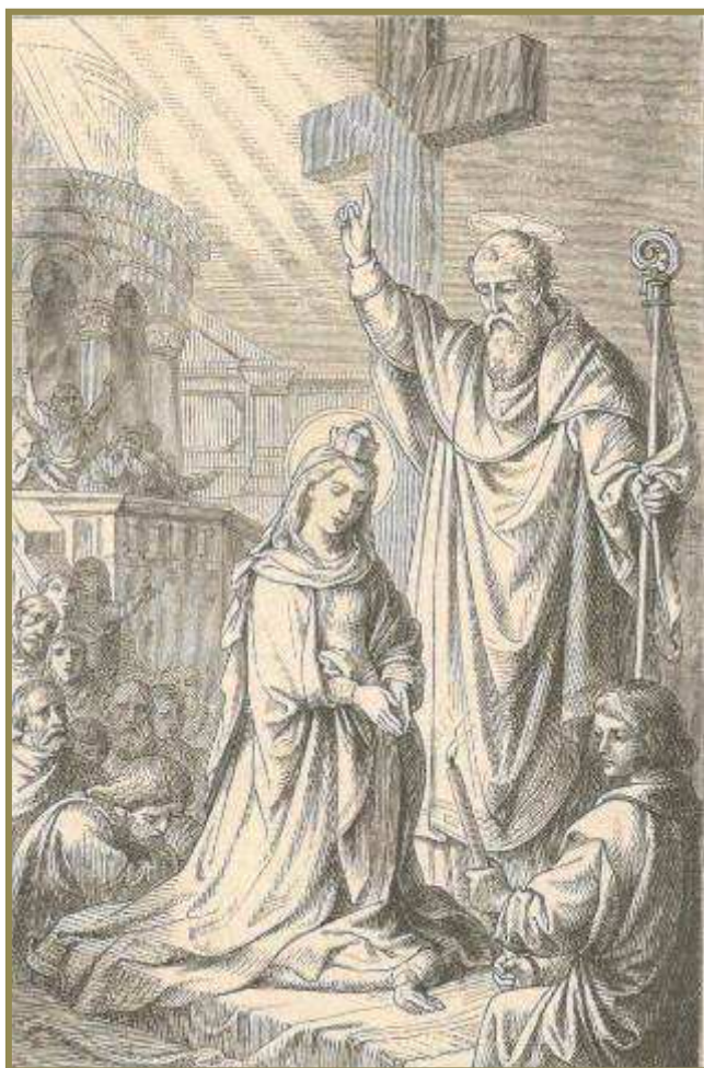
Obrázek je z knihy Leben der Heiligen Gottes 1880

Je také patronkou - barvířů a vlásenkářů; dolů; kopačů pokladů; proti blesku a ohni; k nalezení ztracených předmětů; k odhalení krádeží