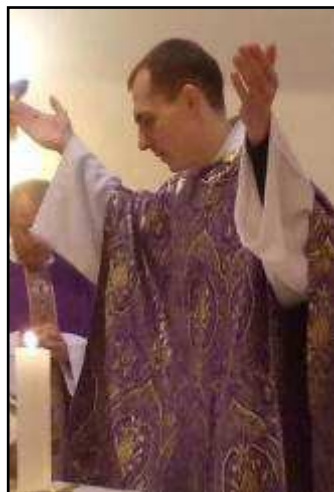
Připravila Marie Ohrálová