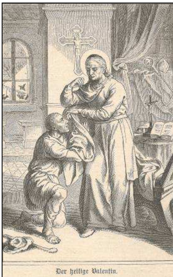
Der heilige Valentin.

Valentin vynikal ve skutcích milosrdné lásky a byl Božím přítelem, protože konal to, co chtěl Ježíš (srov. Jan 15,14). Také pro nás platí, že jsme Ježíšovi přátelé, budeme-li činit to, co nám v evangeliu přikazuje. Pak ponese ovoce a Otec nám dá, oč ho v Kristově jménu poprosíme, podobně jako splnil prosbu sv. Valentina, když se modlil nad slepou dívkou.